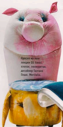
Кресло из коллекции Bi Amici, хлопок, полиуретан, дизайнер Гаэтано Пеше, Meritalia.