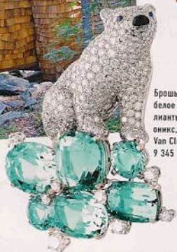
Брошь Ours Polaire, белое золото, бриллианты, сапфиры, оникс, турмалины, Van Cleef & Arpels, 9 345 600 руб.