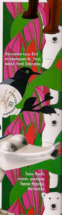
Настенные часы Bird из коллекции Re_Vinyl, винил, Pavel Sidorenko.

Мебель и аксессуары в виде животных — вещь хорошая: в доме от них веселей, а кормить и выгуливать их не надо.