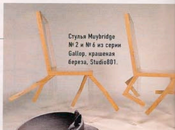
Стулья Muybridge № 2 и № 6 из серии Gallor, крашеная береза, Studio801.