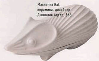
Масленка Rat, керамика, дизайнер Джонатан Адлер, $68.