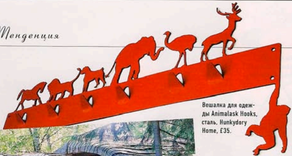
Вешалка для одежды Animalask Hooks, сталь, Hunkydory Home, £35.